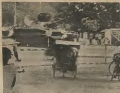
TANKINAN DILANTI PALACIO DI SOEKARNO

LISA OBSERVADOR Y KEIDA NA ALFURA DI TUR ULTIMO NOTICIA NAN.